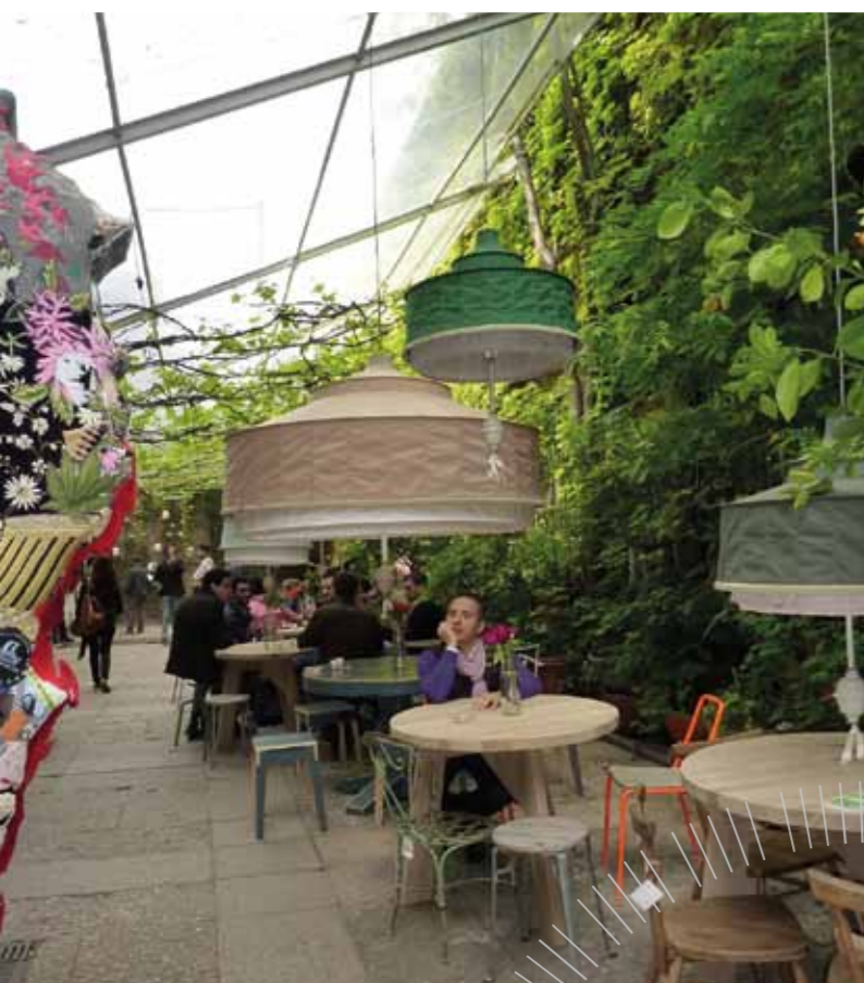
Spazio Rossana OrlandiFuori Salone 2012