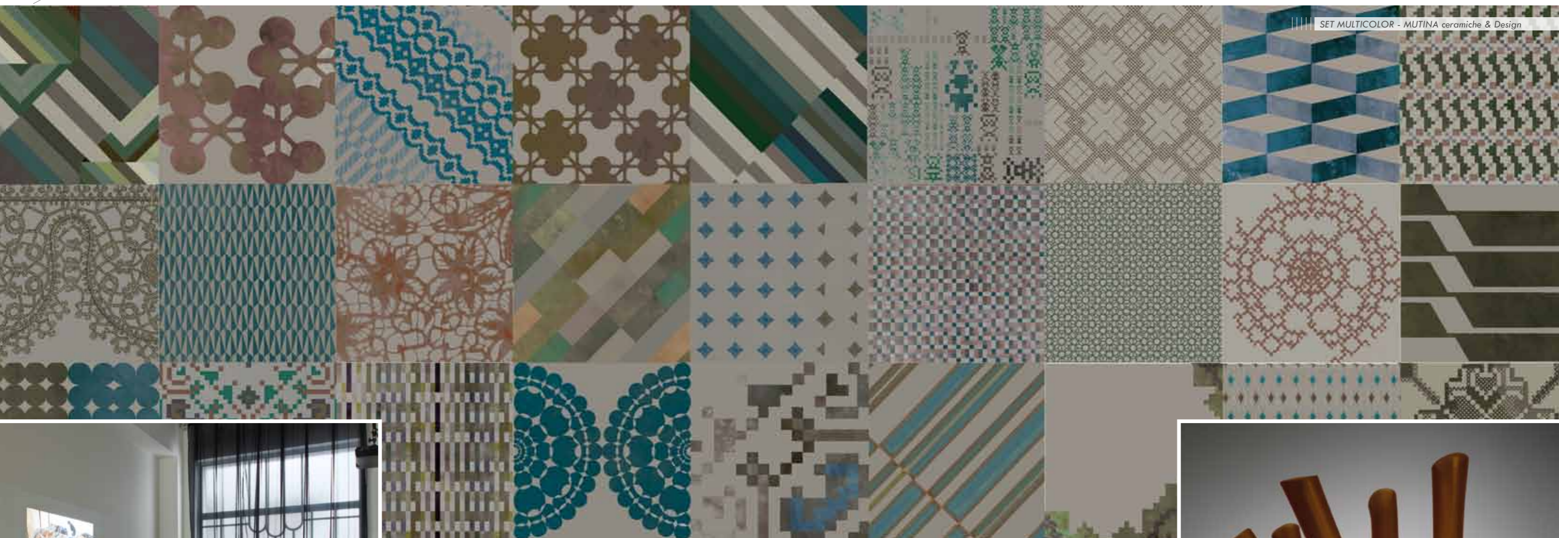
SET MULTICOLOR - MUTINA ceramiche &amp; Design