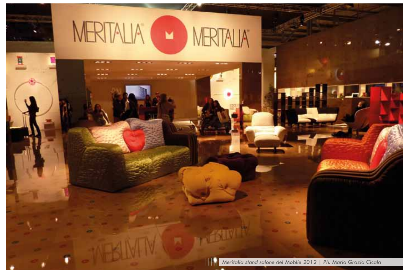
Meritalia stand salone del Mobile 2012