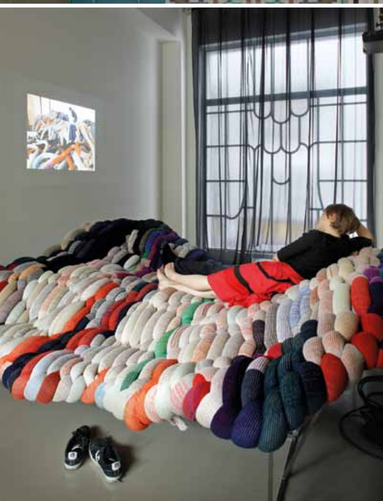
CHEVALIER-MASSON, JULIE VANDENBROUCKE &amp; 51N4E | letto diurno Belgium is Design

Interessantissima PERSPECTIVES, una mostra che intende tracciare un quadro esaustivo del design belga contemporaneo, frutto della collaborazione tra le più importanti organizzazioni ed enti promotori del design in Belgio. La manifestazione, si è svolta nell'ambito della Design Week di Milano, presso la sede della Triennale di Milano, e ha visto la partecipazione di 25 designer e aziende, emergenti e affermati. Dove si situa la linea d'orizzonte del design contemporaneo? Quali sono le sfide presenti e future da affrontare? Qual è lo scopo del progettare? Attraverso una collezione di prototipi, prodotti, servizi, progetti e sistemi, Perspectives ha offerto una raccolta di prospettive dalle quali partire per riflettere sull'influenza e sull'impatto del design nella quotidianità. Due dei più significativi lavori appartengono alla coppia di designers: CHEVALIER-MAS-