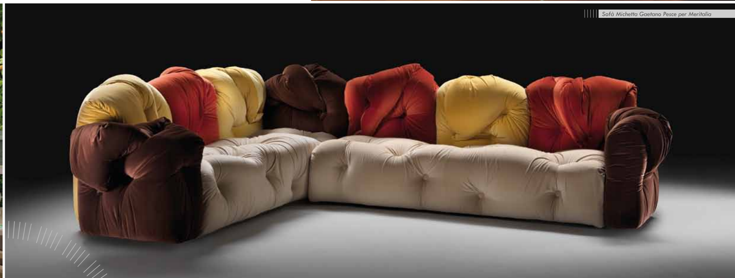
Sofà Michetta Gaetano Pesce per Meritalia